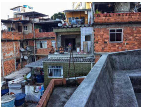
图 3 “丛林深处”

丛林法则第二条，“穿着需要低调，最破、最旧的衣服是你的护身符”，某老师这样告诉我。除了去学校等必要场合，我基本穿简单、朴素的短裤、短袖。记得有一次，我和几位华裔老师相约打排球，到了地方，一位有着多年里约生存经验的华裔老师打量我一番，然后说：“你竟然敢穿长裤，这么正式，很容易被抢啊。”我不禁哭笑不得，那天我确实忘记了，但凸显里约默认的生存 Dressing code（着装准则）可见一斑。另外，你还需要避免一些特定的穿着图案。这是一位街边卖菜的巴西大妈的忠告，她也许曾救了我一命。记得那天我去买菜，一位巴西大妈看我面善，便让我帮她看下场子，她临时有点事，我想都没想便答应。等了约 10 分钟，巴西大妈回来，她竟然盯着我的衣服看，她用葡语问我：“你是一点也不怕死吗？”我愕然，心想怎么年纪大的同志也不讲武德，便问大妈何出此言，大妈指着我的 T 恤说：“你穿这件衣服，去贫民窟会被打死的，这是很容易的。”我低头一看，原来 T 恤上的图案是一个 Batman（蝙蝠侠），大妈解释说：“里约是犯罪天堂，我们最讨厌、最痛恨蝙蝠侠，因为蝙蝠侠打击罪犯，小伙子你赶快把这件衣服烧掉吧，再也别穿了。”原来，我竟然在不知情的状况下，如此胆大包天，与整座“高谭市”的神秘力量在“作对”。于是，这件蝙蝠侠的 T 恤就被放进箱子的底层，自此不见天日。