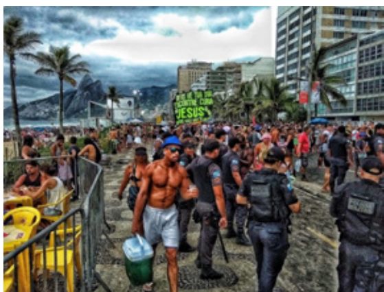
图5 秩序与混乱 作者拍摄于里约的海滩大道

观察如今的里约，你仍能赞叹这场伟大相遇的遗产。自1502年葡萄牙探险家佩德罗称里约为“Rio de