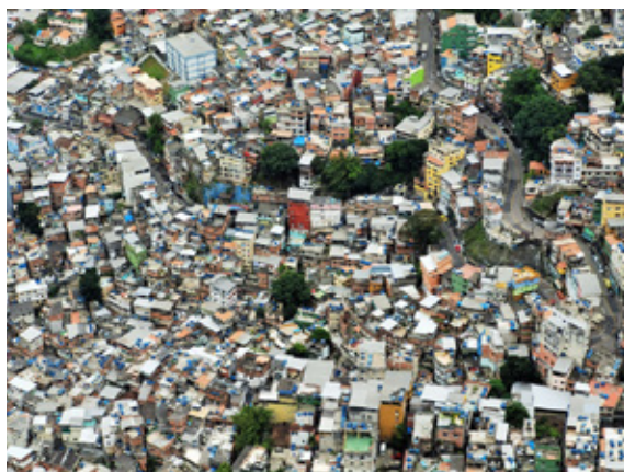
图2 Rocinha 贫民窟远景

丛林法则第一条，避免在错误的时间出现在错误的地方。比如，夜晚市中心就十分危险，那里是吸毒者、抢劫犯和流浪汉的天下。如果晚上出现在那里，肯定是免不了被迫“捐献”一些财物。记得有一次，我去市中心一栋十分摩登的大楼办事，出来时天色已很晚。更不巧的是，我走错了一个街区，结果发现白天繁华的街道，晚上竟然躺满流浪汉。他们睡在街道旁边，似乎那里就是他们的地盘，他们见我十分好奇，几个流浪汉缓缓踉跄着围了上来，如同僵尸一般，慢慢向我逼近，我似乎感觉到一丝危险及尴尬，便赶紧跑回大楼内用软件叫车。摩登大楼的门卫告诉我，这里晚上经常发生持刀抢劫，基本是这些流浪汉所为。我听了不禁脊背发凉，仿佛幸运地逃过一劫。