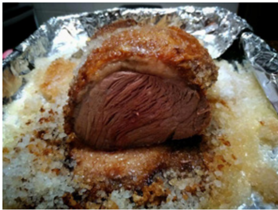
图4 自制巴西烤肉

烤肉代表了巴西粗犷、狂野的草原文化。这种集体“撸串”的行为特别能拉近友情和亲情。巴西人喜欢在海滩烧烤，周末一家人其乐融