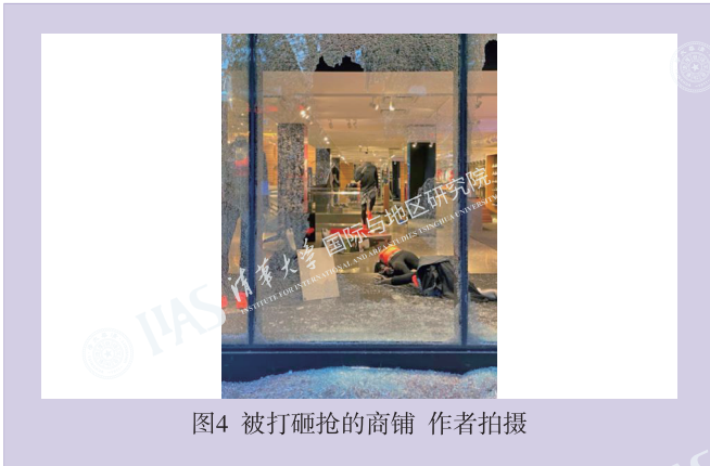
图4 被打砸抢的商铺

那天傍晚，在抗议队伍离开后，我来到主街上查探情况。令我有些惊讶的是，这时人群才刚散去，已有好些民众主动开始清扫起大街。人们齐心协力打扫着破碎橱窗的玻璃碴，收拾被倾翻在地的花基泥土。不久后我也在网上看到了一个类似的视频。这次事件的震中——明尼阿波利斯市在抗议活动中多地被损毁，甚至有一栋警局被直接烧毁。同样地，待抗议活动稍微平息后，当地许多民众便自发上街，打扫这个曾经美好的家园。其中记者对一位志愿者的采访令我印象深刻：镜头扫过一片满目疮痍的废墟，街上有数百人正在热火朝天地分工合作。人们或搬运毁坏的砖瓦玻璃，或用水冲洗地面，或拿着扫把清扫。一位非裔的年轻女孩面对镜头坚定地说道：“这才是明尼阿波利斯，这才是明尼苏达，这才是社区。那些发生在晚上的事（打砸抢烧），那些人（暴力者）绝大多数都不是本地人。现在你看到的（在做清扫的人们）才是真正的我们的市民。”