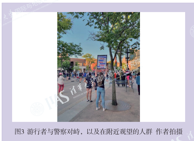
图3 游行者与警察对峙，以及在附近观望的人群

5月25日，非裔美国人George Floyd在明尼阿波利斯市被白人警察暴力执法，压迫颈部窒息致死。事件一出，举国震动，全美各地接连掀起“Black Lives Matter”等反种族歧视、反暴力执法的游行运动。过程中，多地局势失控，演变成烧毁警车警局，抢砸沿街商铺的暴力活动。我住处附近的大街也未能幸免。麦迪逊的抗议活动在5月30日前后达到高潮，政府出动了警力维持秩序，但仍有许多商铺玻璃在僵持中被砸毁，玻璃碎屑落了一地。不过庆幸的是，整个抗议过程中，虽有一些人乘乱发泄情绪、打劫商铺，但普通民众并未受到攻击，大多数人也一直保持着理性。