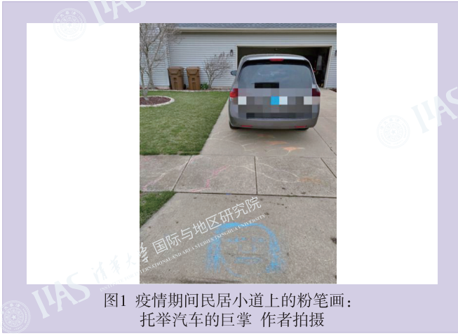
图1 疫情期间民居小道上的粉笔画： 托举汽车的巨掌

坏了的美国人，尤其是有孩子的人家，开始在自家门口的水泥地上用彩色粉笔作画。有的画了格子跳房子，有的画了满地生机勃勃的花，有一家还在门口停着私家车的地上画了一只巨掌，仿佛正要托起车子，看着甚是有趣。这其中，我最喜欢的是一个圆盘样的笑脸和粗体写着的一句话：“Don't Worry, Be Happy!”