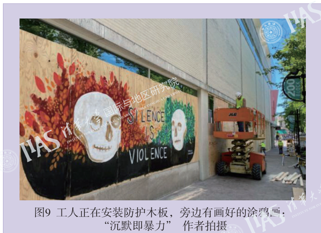
图9 工人正在安装防护木板，旁边有画好的涂鸦画：“沉默即暴力”