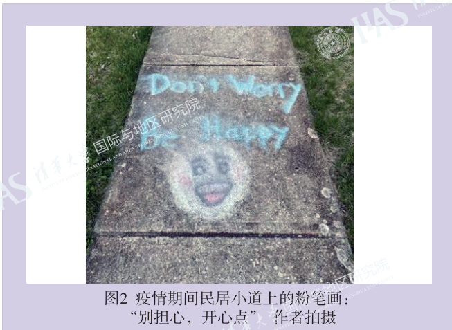
图2 疫情期间民居小道上的粉笔画： “别担心，开心点”

这些地面涂鸦有的简单，有的明媚，相同的是都传递出了人们的积极与乐观。我常常一边散步，一边低头欣赏着地上跃动的色彩，心情就豁然开朗了。自疫情伊始便积压在心头的那些对家人的担忧、对疫情发展的忧虑、对学习受到影响的无奈、对老师同学的不舍……种种压抑忽然散去了不少。联想到在微