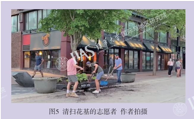
图5 清扫花基的志愿者

那天傍晚，在抗议队伍离开后，我来到主街上查探情况。令我有些惊讶的是，这时人群才刚散去，已有好些民众主动开始清扫起大街。人们齐心协力打扫着破碎橱窗的玻璃碴，收拾被倾翻在地的花基泥土。不久后我也在网上看到了一个类似的视频。这次事件的震中——明尼阿波利斯市在抗议活动中多地被损毁，甚至有一栋警局被直接烧毁。同样地，待抗议活动稍微平息后，当地许多民众便自发上街，打扫这个曾经美好的家园。其中记者对一位志愿者的采访令我印象深刻：镜头扫过一片满目疮痍的废墟，街上有数百人正在热火朝天地分工合作。人们或搬运毁坏的砖瓦玻璃，或用水冲洗地面，或拿着扫把清扫。一位非裔的年轻女孩面对镜头坚定地说道：“这才是明尼阿波利斯，这才是明尼苏达，这才是社区。那些发生在晚上的事（打砸抢烧），那些人（暴力者）绝大多数都不是本地人。现在你看到的（在做清扫的人们）才是真正的我们的市民。”