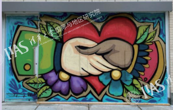
图7 麦迪逊街上的木板涂鸦画