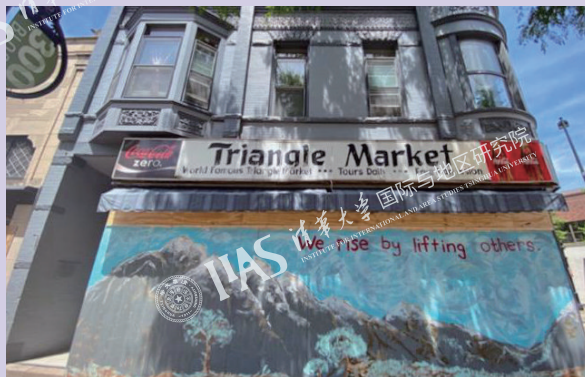
图8 麦迪逊街上的木板涂鸦画：“我们因助人而强大”