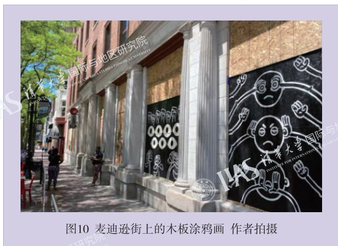
图10 麦迪逊街上的木板涂鸦画

当我看着这些巨幅画作，想着不久前同样出现在城市地上的那些大大小小的粉笔画，我前所未有地感受到了艺术带来的震撼和影响，也仿佛更加真切地听到了这个城市中人们的声音：